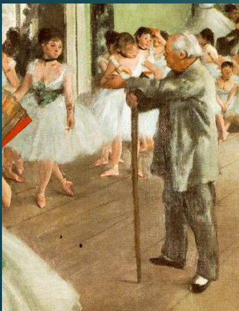
una giovane ballerina sta provando dei passi di danza sotto la guida del maestro