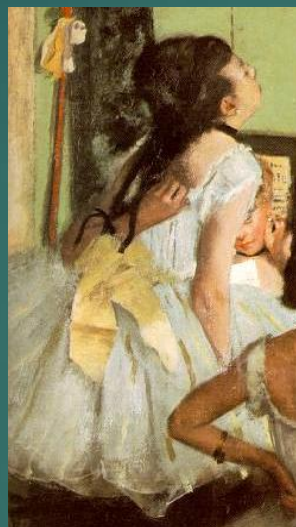
Una ballerina con il fiocco giallo sul pianoforte che si gratta la schiena